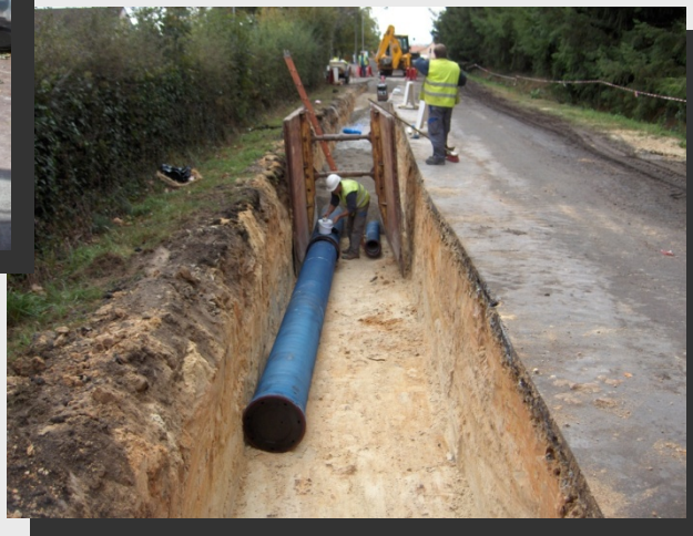
Lot 1 - Limoges