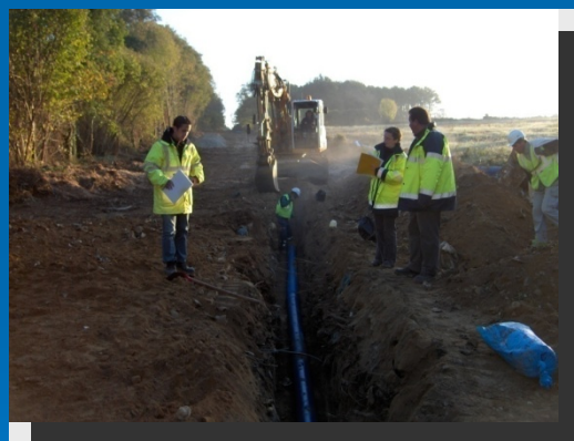
Lot 4 – Lieu-dit « Cramaud » proximité Rochechouart

La convention constitutive de groupement de commandes en date du 21 avril 2008 désigne le Président du SYTEPOL comme coordonnateur du groupement chargé de la gestion des procédures de passation des marchés, de leur signature et de leur notification.