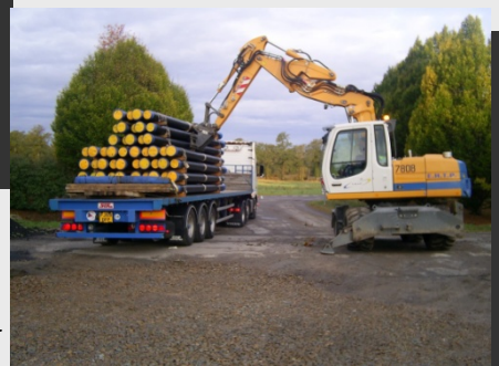
Déchargement fonte TT