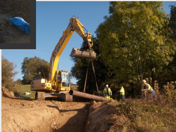
Lot 4 – Préparation d'un fonçage