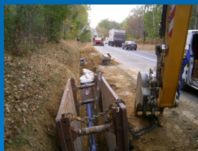
Pose \varnothing 200 en surprofondeur le long de la RD 679

L'emprunt complète le financement de l'opération.