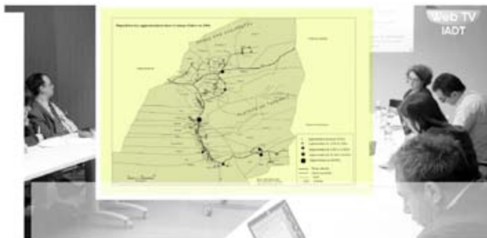
Badreddine YOUSFI Université Oran 2 (Algérie)